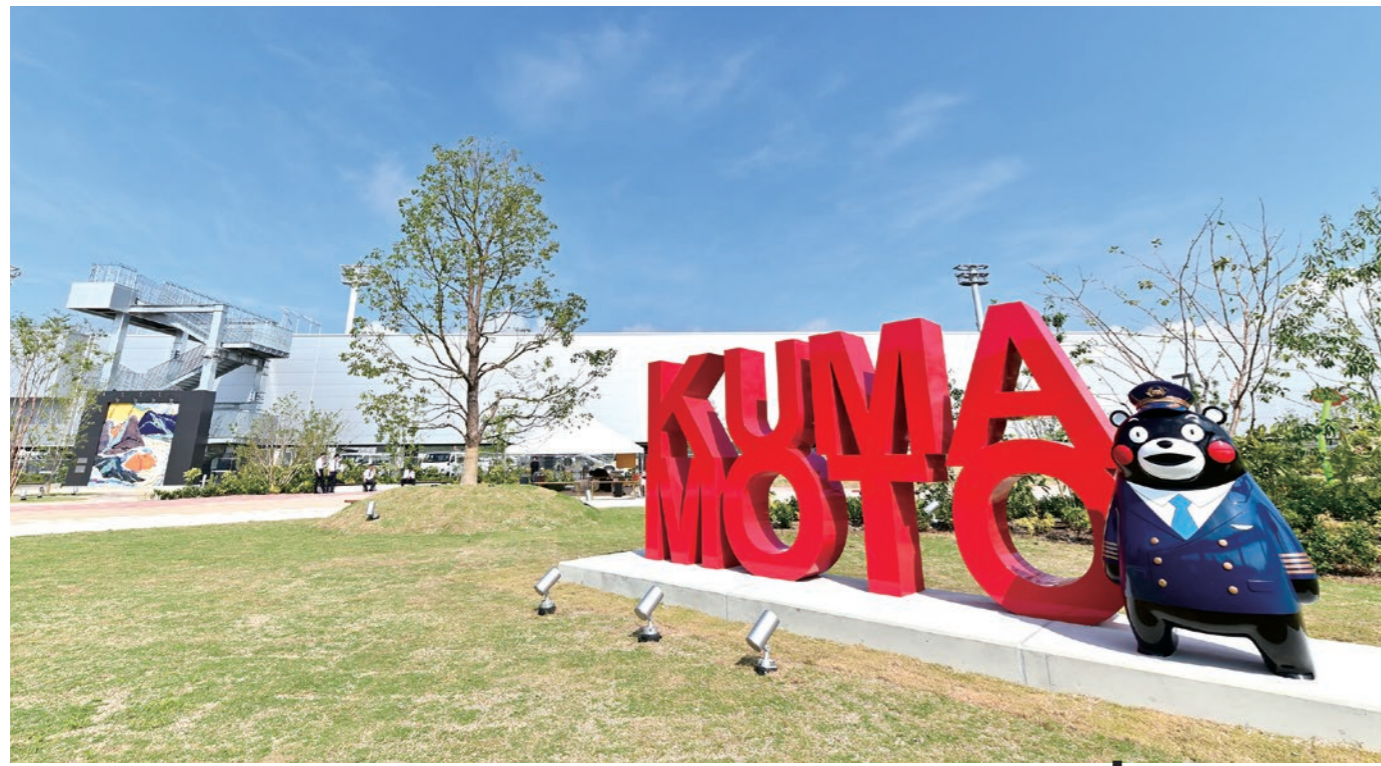
©2010 熊本県くまモン KL00124