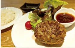
▲꼭신하고 육즙이 흘러넘치는 무침가 '긴카쿠 햄버그스테이크'(150g·1,780엔) +라이스 세트(200엔)

아소 구마모토 공항에 4월 말 오픈한 '가쿠노신 햄버그스테이크'가 자랑하는 메뉴는 일본산 소고기와 이와테산 핫킨톤 돼지고기·소금 누룩·반죽 재료를 사용한 '긴카쿠 햄버그스테이크'입니다. 추천하는 먹는 법은 세 가지! 우선 아무것도 곁들이지 않고 소금 누룩과 고기의 감칠맛을 맛보고, 그 다음에는 소금·고추냉이를 곁들여 먹고, 마지막으로 구마모토의 식재료를 사용한 일본식 소스·폰즈와의 조합을 즐겨봅니다. 긴카쿠 외에 저온에서 훈제한 '긴카쿠 햄버그스테이크'도 있습니다. 또한 구마모토산 히노히카리 라이스, 산토리 규슈 구마모토 공장 직송 생맥주 등 이와테와 구마모토의 "맛"이 조화를 이루고 있습니다.