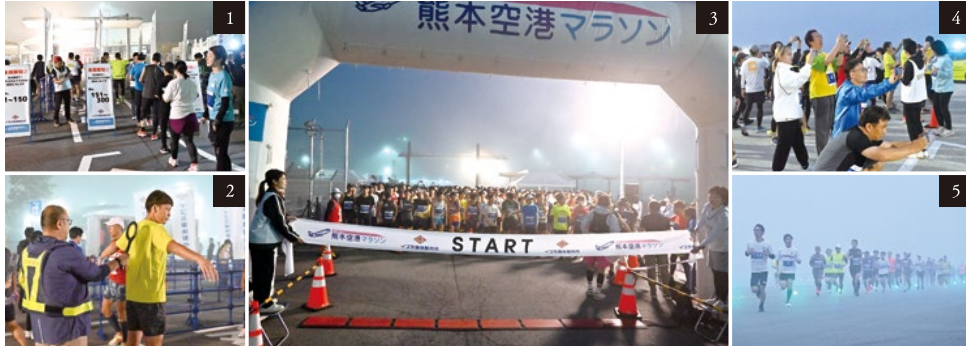
Early morning Runway Marathon