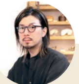
구스다 사토시 씨

표지에 사용된 '소라요카 구역'의 메인 이미지는 공항이 위치한 마시키마치에 거주하는 디지털 아트 작가 구스다 사토시 씨의 작품으로, 사진 속의 콜라주와 디지털 페인팅을 조합해서 '마음 설레는 공항'의 이미지를 표현했습니다.