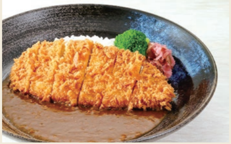
▲'몽베르 포크 등심 돈가스 카레' 1,848엔(세금 포함) 촉촉한 돈가스와 인기 많은 카레의 조화가 일품!

'지역에서 사랑받는 최고의 호스피탈리티 레스토랑'을 목표로, 햄버그 스테이크나 오므라이스와 같은 기본 양식은 물론, 지역산 식재료를 사용해서 로열 호스트답게 소개하는 메뉴와 음료 바, 아이스크림 선디 등의 디저트를 준비. 구마모토 공항점 한정 메뉴도 있는데, 자연이 풍요로운 미나마타의 산에서 자란 브랜드 돼지고기 '몽베르 포크'를 사용하는 돈가스 카레와 스테이크, 토종닭 '아마쿠사대왕'을 사용하는 닭고기 계란덮밥, 어묵 샐러드, 거자 연근 등 8가지 메뉴를 즐길 수 있습니다. 엄선한 식재료와 '로이호'의 정성이 엮어내는 담정 고유의 맛은 각별합니다.