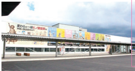
소라요카 방문객 센터

'소라요카 다이닝'에서는 앞서 오픈한 '포타마'와 '가쿠노신 햄버그', '로열 호스트'에 이어 '스가노야'와 'Milksha ft. 이치류니지 1624'가 11월까지 차례로 오픈하고, 음식점 구역이 확충되어 개인의 취향에 맞추어 테이크아웃이나 점포 내 식사 등을 선택해서 이용할 수 있습니다.