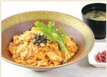
◀구마모토의 대지에서 자란 토종닭을 사용한 '구운 아마쿠사대왕 닭고기계란덮밥' 1,780엔(세금 포함)