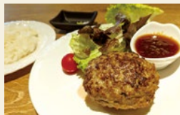
▲松软且肉汁满满的无添加“金格汉堡排”(150g 1,780日元) + 白饭套餐 (200日元)

4月底在阿苏熊本机场开业的“格之进汉堡排”，招牌是使用日本国产牛肉与岩手产白金猪肉、盐麩、增粘料的“金格汉堡排”。共有三种推荐吃法！首先，先不沾任何调味，品尝盐麩与肉的原味，接着，再佐上盐、芥末享用，最后，再组合使用熊本食材制成的和风酱料、橙醋体验多种风味。除了金格之外，还有低温燻制的“薰格汉堡排”。再搭配熊本产越光米饭、三得利九州熊本工厂直送的生啤酒等，以岩手与熊本的“美味”谱写出和谐乐章。