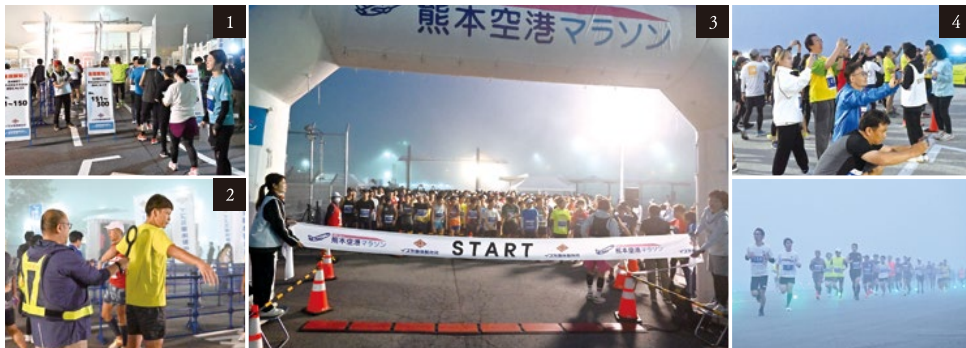
Early morning Runway Marathon