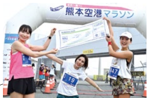
参与奖是特别设计的毛巾！ 下一届大会欢迎您再来挑战。