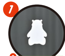
1 Sorayoka Dining

旅客航站楼大楼与“Sorayoka Dining”（商业栋）等机场内各处都装饰着熊本熊。这是熊本县为了向国内外宣传熊本熊魅力所推进的“熊本熊乐园化构想”的一环。其中有些“隐匿熊本熊”藏得很隐密。前来机场时，请务必寻找看看！！