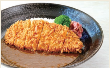
▲“Mont-Vert Pork 里脊猪排咖喱饭” 1,848日元(含税) 鲜嫩多汁的猪排与 人气咖喱饭 完美搭配!

以“地区上备受喜爱的No.1款待式餐厅”为目标，不仅提供汉堡排、蛋包饭等经典西餐料理，还结合当地食材，供应展现出Royal Host风格的特色菜单，此外还有饮料吧、圣代等甜点选择。自然丰富的水俣山区品牌猪“Mont-Vert Pork”所制作的炸猪排咖喱饭、牛排、当地特产地鸡“天草大王”的亲子盖饭、竹轮沙拉、黄芥末莲藕等，供应8道熊本机场店限定的独家料理。以精选食材与“Royal Host”交织出此地的独特风味。