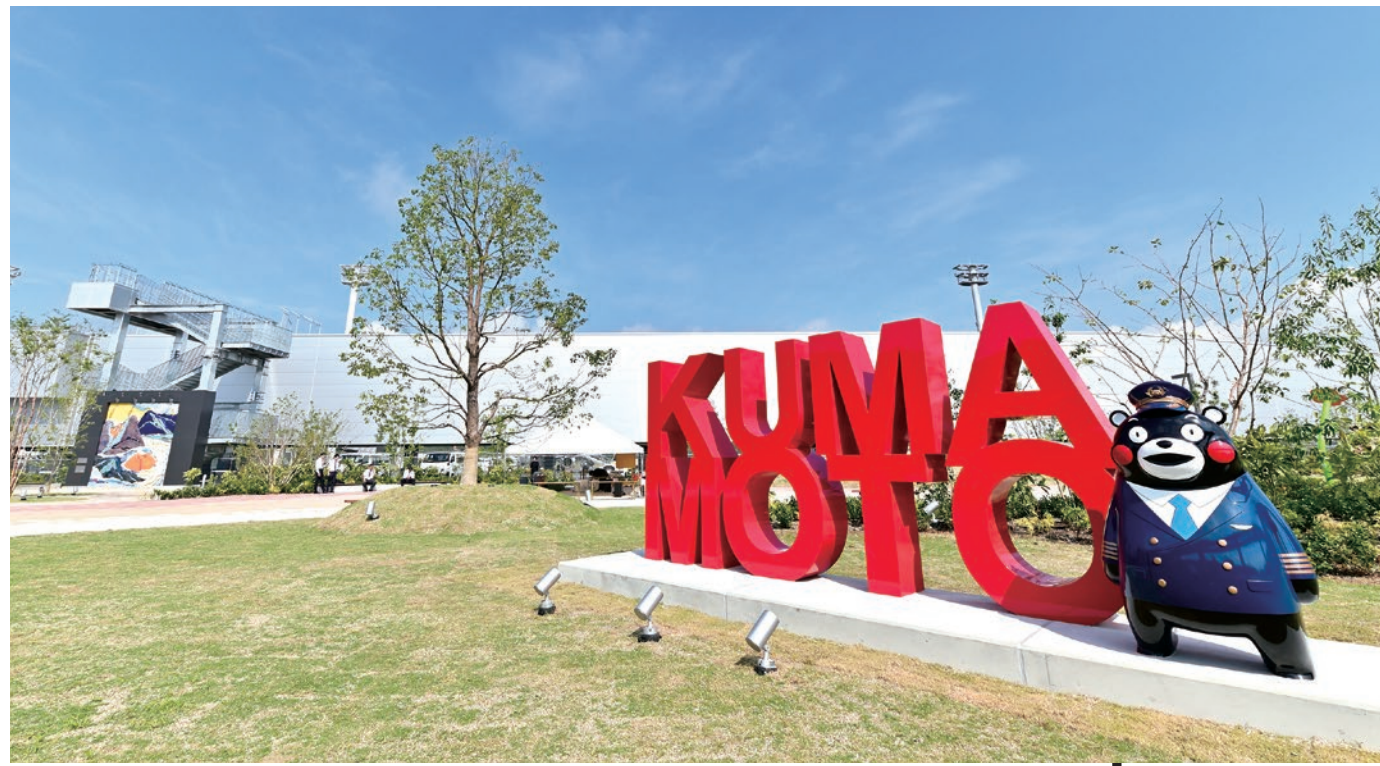
©2010 熊本県くまモン KL00124